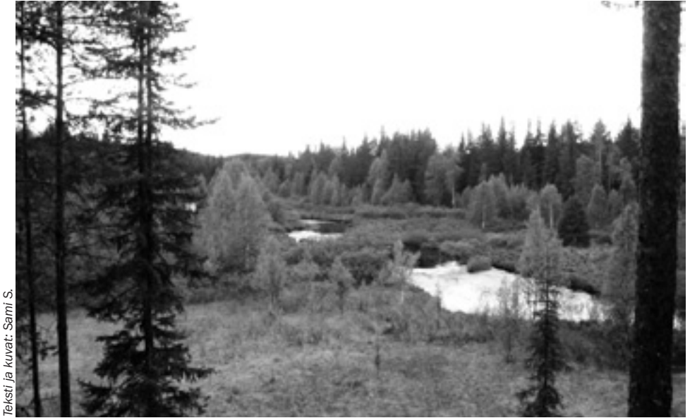
Teksti ja kuvat: Sami S.

Ohtaaja on ehdottomasti alkukesän paikka. Vettä riittää vielä ja pohjan kasvusto ei ole valloittanut koko jokea. Kuva laavulta ylöspäin.