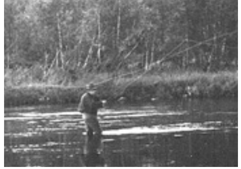
Mm. alaheiton "isi" messujen esiintyjänä.